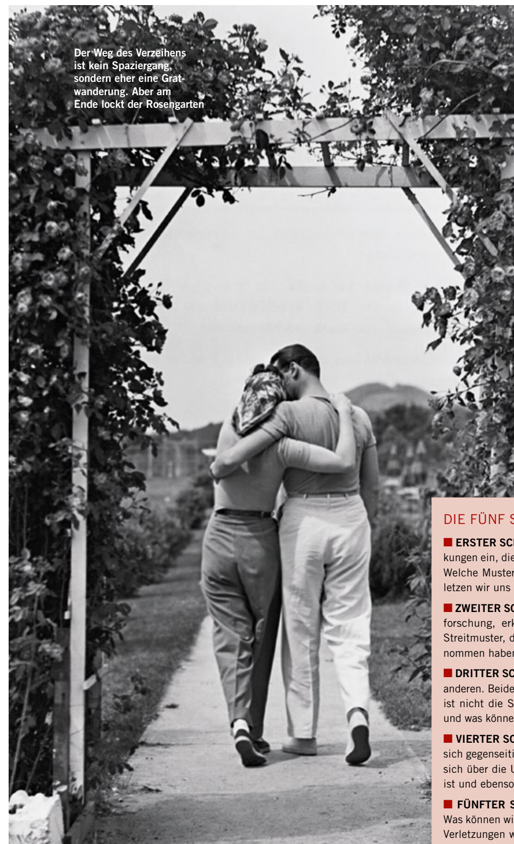
Der Weg des Verzeihens ist kein Spaziergang, sondern eher eine Gratwanderung. Aber am Ende lockt der Rosengarten