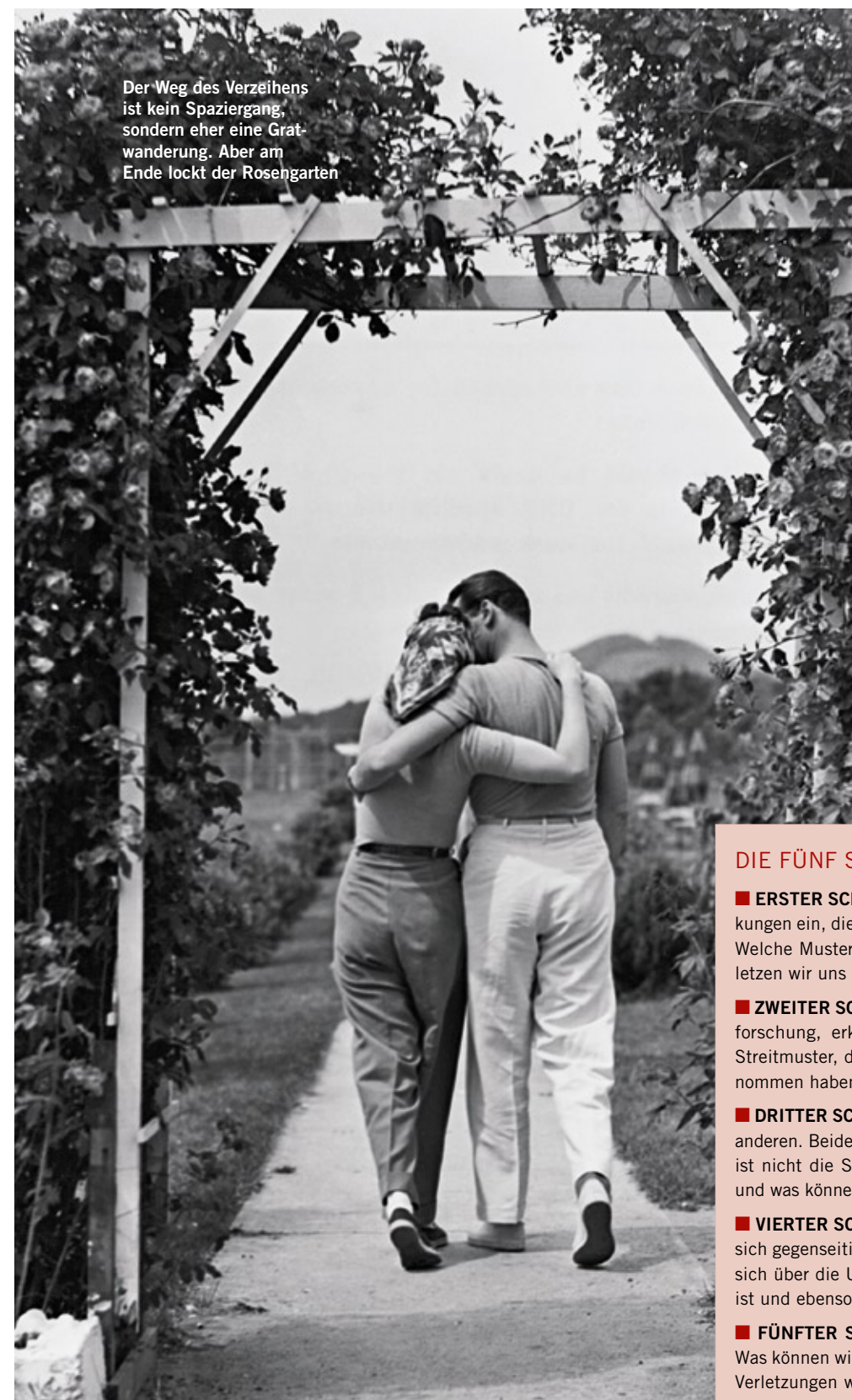
Der Weg des Verzeihens ist kein Spaziergang, sondern eher eine Gratwanderung. Aber am Ende lockt der Rosengarten